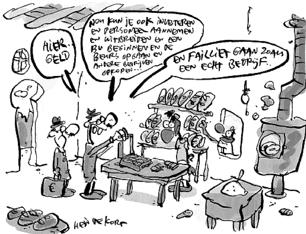
Illustratie: Hein de Korf