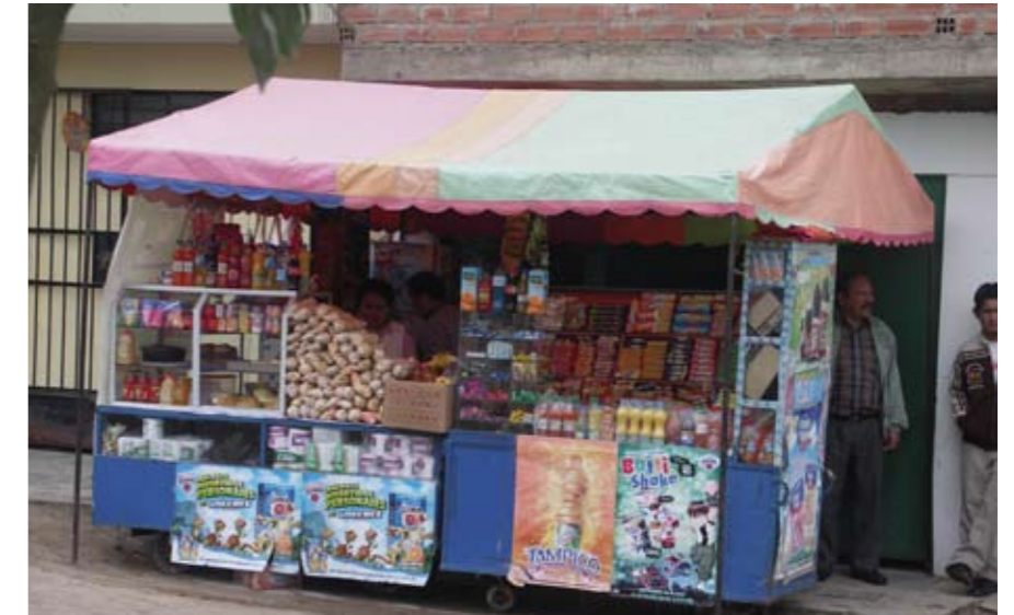
Een microkredietklient van FINCA PERU in zijn winkeltje.

Microkredieten en microfinancieringsinstellingen zijn in Peru ruim verspreid. Waarin verschillen de partners van Oikocredit dan in hun aanpak? Het zeer persoonlijke contact waarbij men probeert de behoeften goed te begrijpen, de adviesverlening en training moeten er samen voor zorgen dat de leningnemers slagen in de opstart van hun eigen zaak. Alleen geld ter beschikking stellen is onvoldoende. Het gaat hier tenslotte om microfinanciële dienstverlening, niet enkel om een microkrediet.