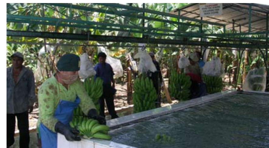
Bananencoöperatie APPBOSA heeft met een lening van Oikocredit een transportbaan voor bananen aangelegd.

Vroeger moesten de boeren de twintig kilo zware bananentrossen op hun schouders verslepen, tot wel 500 meter. Tegenwoordig gaat dit moeiteloos via een transportbaan die over de hele plantage is aangelegd. Dit is beter voor de boeren en voor de bananen. De aanleg van deze installatie kostte 250.000 USD. Voor 150.000 USD deed APPBOSA een beroep op een lening bij Oikocredit. Binnen de dertig maanden denken zij het krediet terug te betalen; een knappe prestatie van het management én de hele ploeg. Maar waarom die haast? Het volgende te financieren project dient zich namelijk al aan. Door afweerwallen te plaatsen kan de plantage beschermd worden tegen de overstromingen van een nabijgelegen rivier.