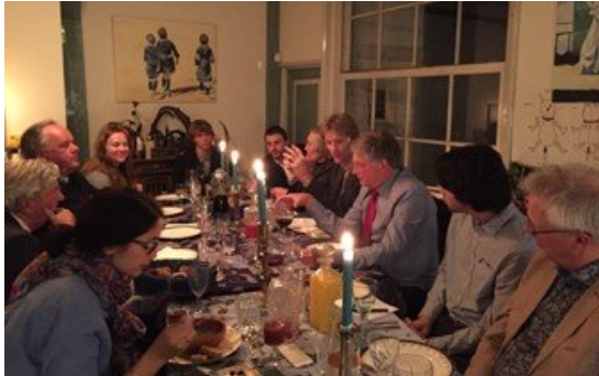
Dis op Dinsdag over Oekraïne (24 maart 2015)

select gezelschap thema's – waar de Worldconnectors wellicht een verschil kunnen maken – worden verkend en uitgediept.