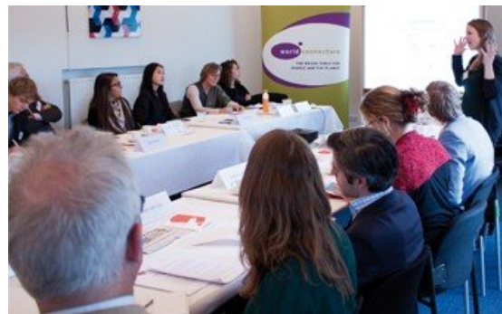
Round Table op Marine-terrein A'dam (3 maart 2015)

worden doorgelicht. Ook nieuw is het platform voor jonge sociaal ondernemers, die er hun activiteiten kunnen presenteren en de gelegenheid kunnen grijpen om advies te vragen over voor hen lastige kwesties.