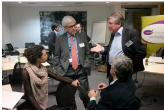
Round Table bij Akzo Nobel (23 november 2015)

Zo werden de vier Round Tables gehost door organisaties van leden, zoals Greenpeace, Akzo Nobel, New World Campus en het Marine terrein in Amsterdam (dankzij Studio Zeitgeist). Tijdens deze ledenbijeenkomsten werden actuele thema's verdiept, zoals het vluchtelingenvraagstuk en de transitie naar een duurzame energiehuishouding.