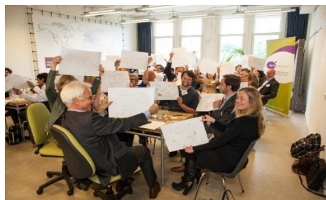
De Worldconnectors tijdens de Round Table bij Impact Hub (23 mei 2016)

In 2016 organiseerde de Vereniging vier Round Tables. De eerste Round Table vond plaats bij de Rabobank. Deze bijeenkomst bestond uit drie delen: een sessie over duurzame energievoorziening, een publieke bijeenkomst rondom de Sustainable Development Goals (SDG's) en een gesloten sessie over de verenigingszaken van de Worldconnectors. In mei kwam het netwerk samen bij de Impact Hub en werd onderzocht hoe de vereniging impact kan creëren. In september werd in samenwerking met Earth Charter Vrienden in het Koninklijk Instituut voor de Tropen ingezoomd op het verbinden van internationale en nationale initiatieven rondom de SDG's. Tijdens de Round Table in november op de Vrije Universiteit van Amsterdam (VU), gingen wij in op de (nood)opvang van vluchtelingen in Nederland en de maatschappelijke veerkracht in Nederland. Deze bijeenkomst was in samenwerking met de VU en het Ministerie van Sociale Zaken en Werkgelegenheid.