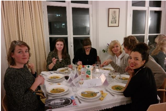
Dis op Dinsdag over Wereldkennisburgers (12 januari 2016)

Naast de Dis, is er in 2016 ook een aantal evenementen met Young Worldconnectors georganiseerd zoals een blogtraining voor alle Young Worldconnectors, in samenwerking met OneWorld. Naar aanleiding van deze training werd ook een reeks blogs gepubliceerd op de Worldconnectors website.